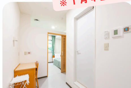
宿泊B棟 (ツインルーム・30部屋)