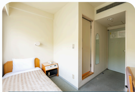
宿泊D棟 (シングルルーム・55部屋)