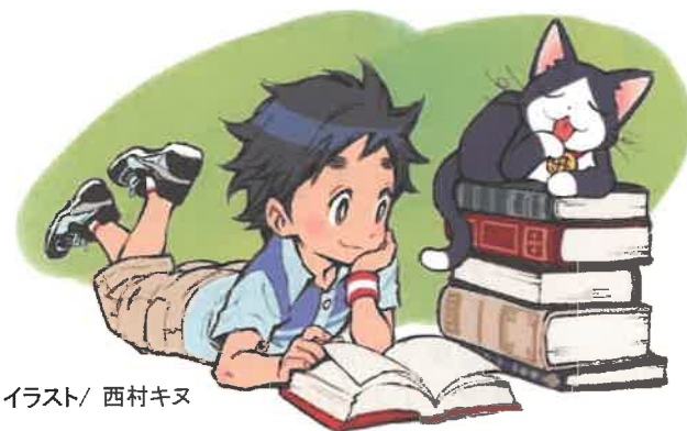
イラスト/ 西村キヌ