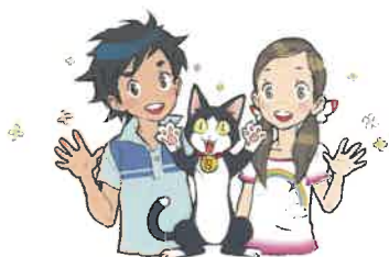
イラスト／西村キヌ

未来を担う夢を持った子どもの健全育成を進めるため、民間団体が実施する自然の中でのキャンプや、科学実験教室などの体験活動、絵本の読み聞かせ会などの読書活動などへの支援を行っています。青少年教育に関する活動を行う民間団体であれば、法人格を有さないグループやサークルなども助成の対象となります。