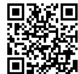
専用フォームのQRコード