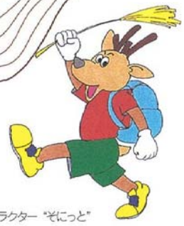
マスコットキャラクター「ゼにっど」