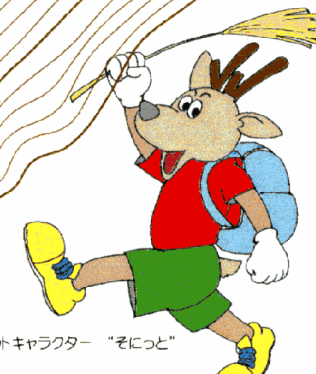
マスコットキャラクター “そいっと”